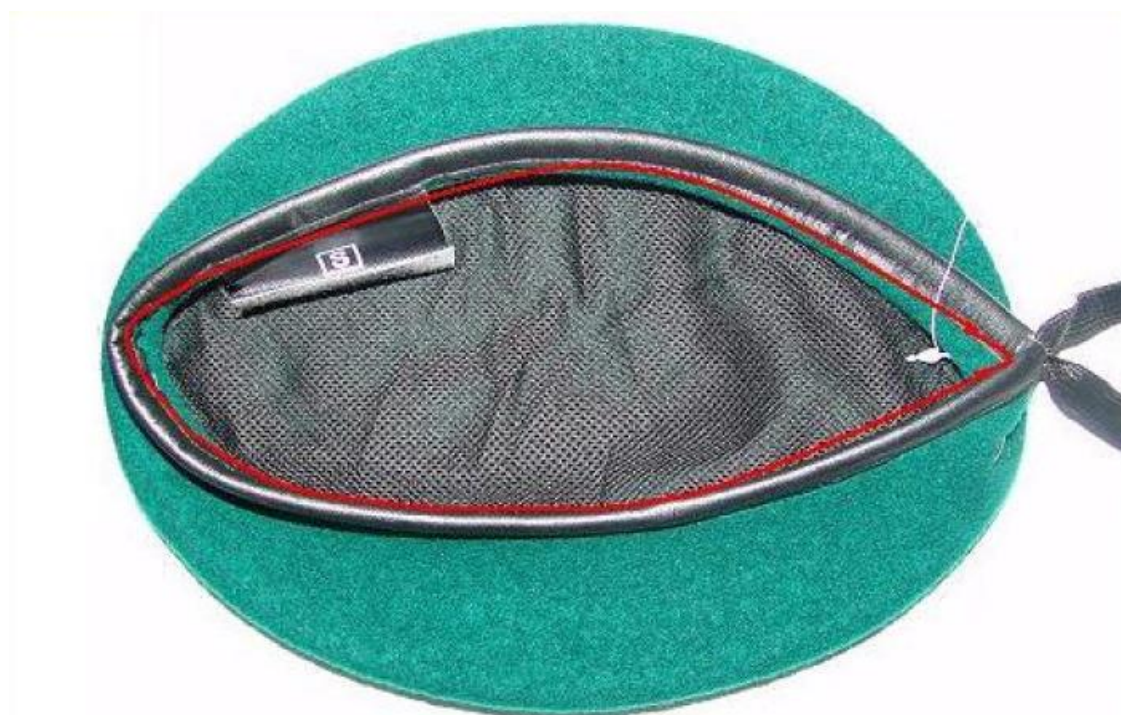
Internal Circle Measurement